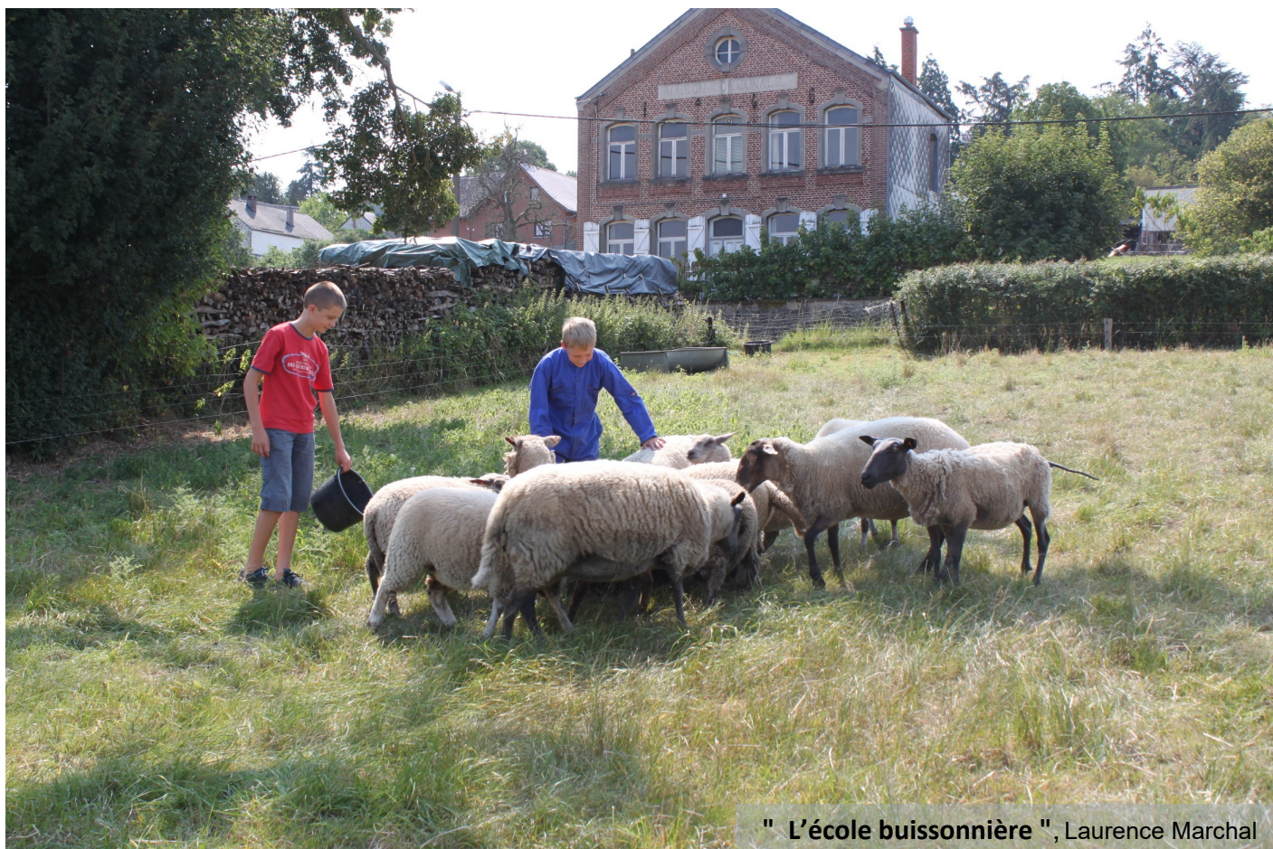
" L'école buissonnière ", Laurence Marchal

Voici une des photos " coups de cœur " de cette expo.