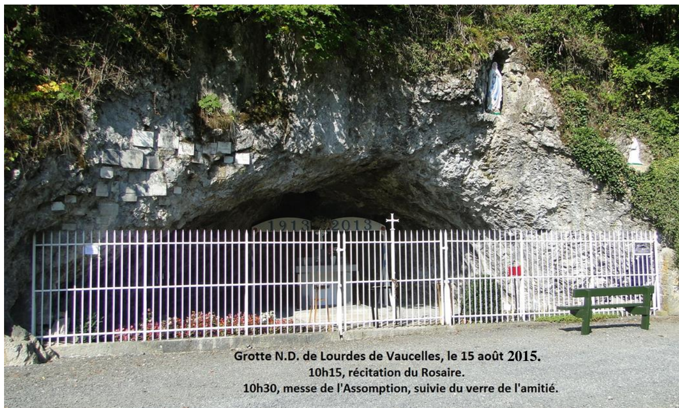
Grotte N.D. de Lourdes de Vaucelles, le 15 août 2015.